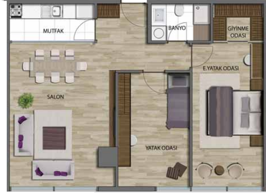
2+1 (BRÜT: 104.70 m 2 )