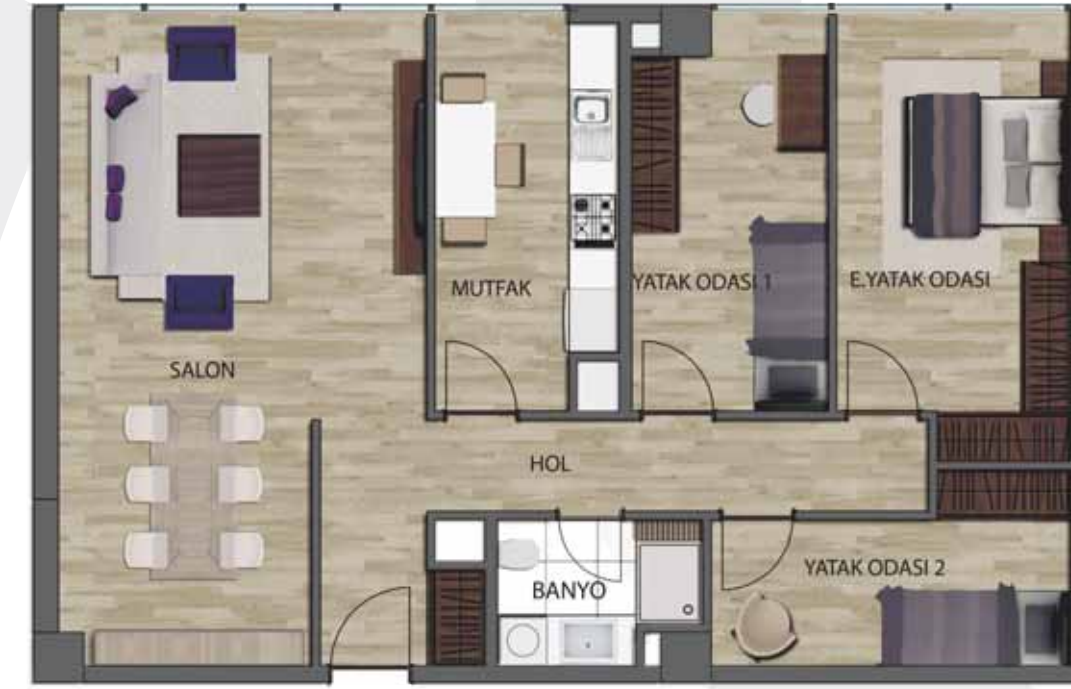
2.5+1 (BRÜT: 132.36 m 2 )