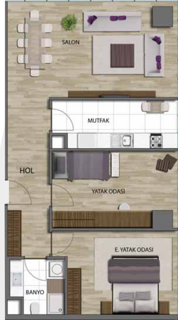
2+1 (BRÜT: 110.37 m 2 )