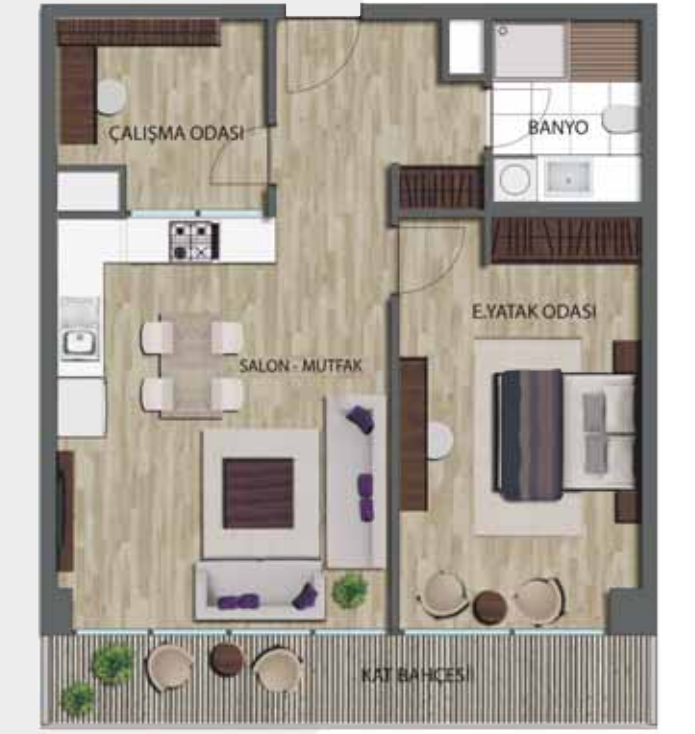
1.5+1 (BRÜT: 94.84 m 2 )